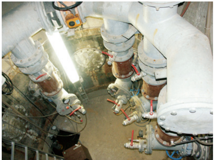
Abb. 4 Innenausbau des Horizontalfilterbrunnens in Trockenaufstellung