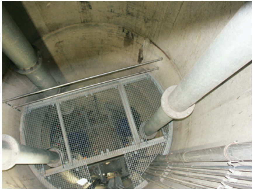
Abb. 3 Blick in den Schacht mit eingebauter Zwischenbühne

Die Herstellung des Schachtes und der Stränge ist ein Spezialverfahren und wurde von der BHG Brechtel GmbH